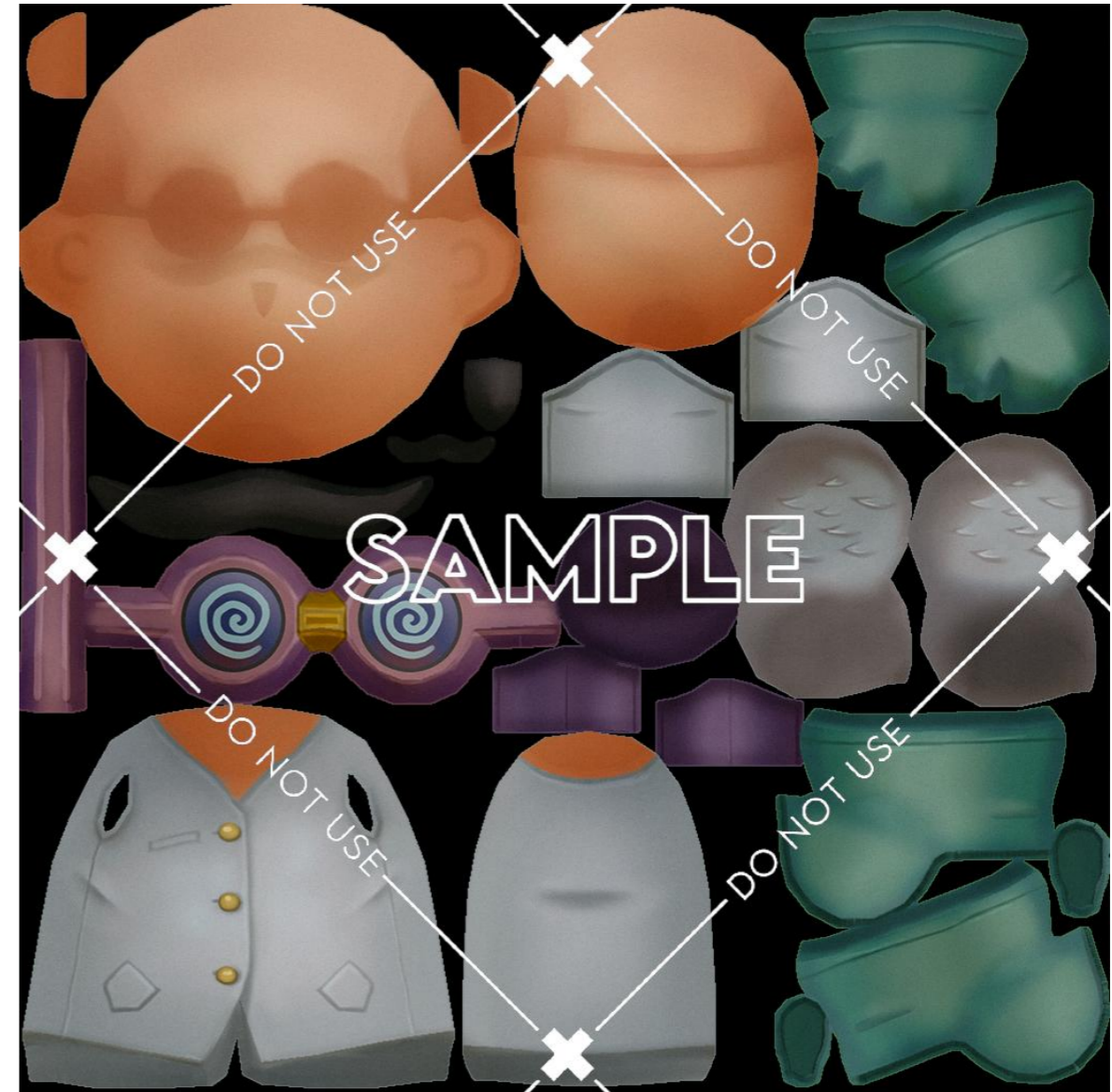
1번 제시물- 제출용 레이아웃